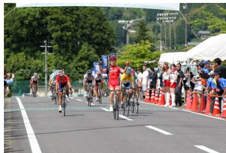
ウ. 5月29日(土) 第2ステージ 熊野山岳コース 118.2km