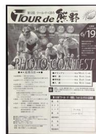
フォトコンテストチラシ