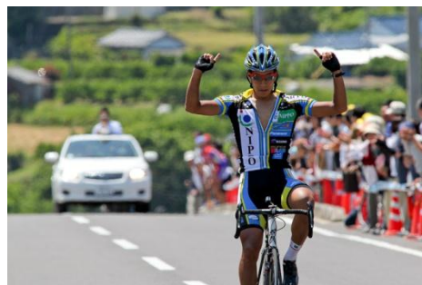
エ. 5月30日(日) 第3ステージ 太地半島周回コース 96km(9.6km x10周)